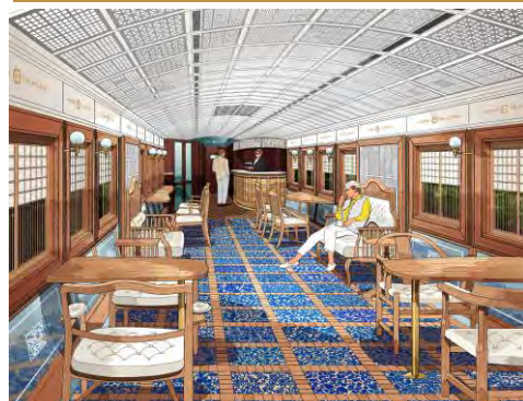
插图为完成后的预测图